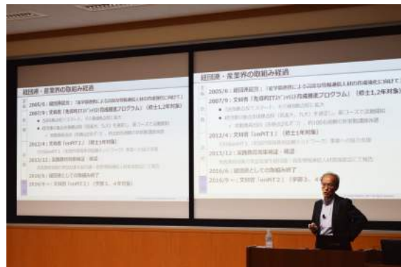
菊池氏の基調講演