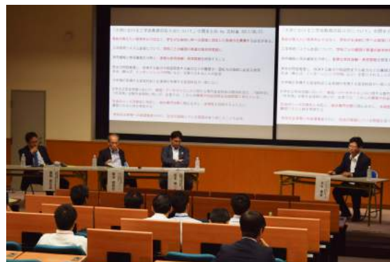
パネルディスカッション